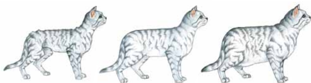
PODVÁHA (1 z 9)

Zhodnocení tělesné kondice kočky je velmi důležité. Pro jeho usnadnění byl vytvořen 9stupňový system hodnocení tělesné kondice :